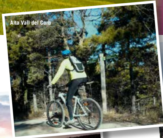
Alta Vall del Corb

El municipi de Llorac es troba situat a la part nord de la Conca de Barberà, a la vora de les zones boscoses de les obagues del riu Corb (EPN). El riu Corb neix al seu terme, al poble de Rauric. A més de la població de Llorac, comprèn els nuclis de Rauric, Albió i la Cirera i el despoblat de Montargull. Tots són pobles petits que viuen principalment de l'agricultura del cereal i la ramaderia i han sabut mantenir el seu encant. Són pobles carregats de patrimoni històric, envoltats de boscos frondosos i un lloc ideal per fer excursions a peu i en BTT. Cal destacar com a punt de referència gastronòmica, els formatges artesanals de l'Albió. És una zona per relaxar-se, i passar un bon cap de setmana descansant i gaudint de l'hospitalitat de la seva gent fent turisme rural.